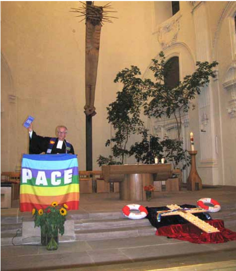
Save me: Die Flüchtlingsproblematik war auch Thema des zweiten Politischen Nachtgebetes in der Freiburger Universitätskirche

im Engagement für Flüchtlinge und Asylbewerber/innen, berichteten von der – zwischenzeitlich leider aufgelösten – Kommission Asyl/Flüchtlinge