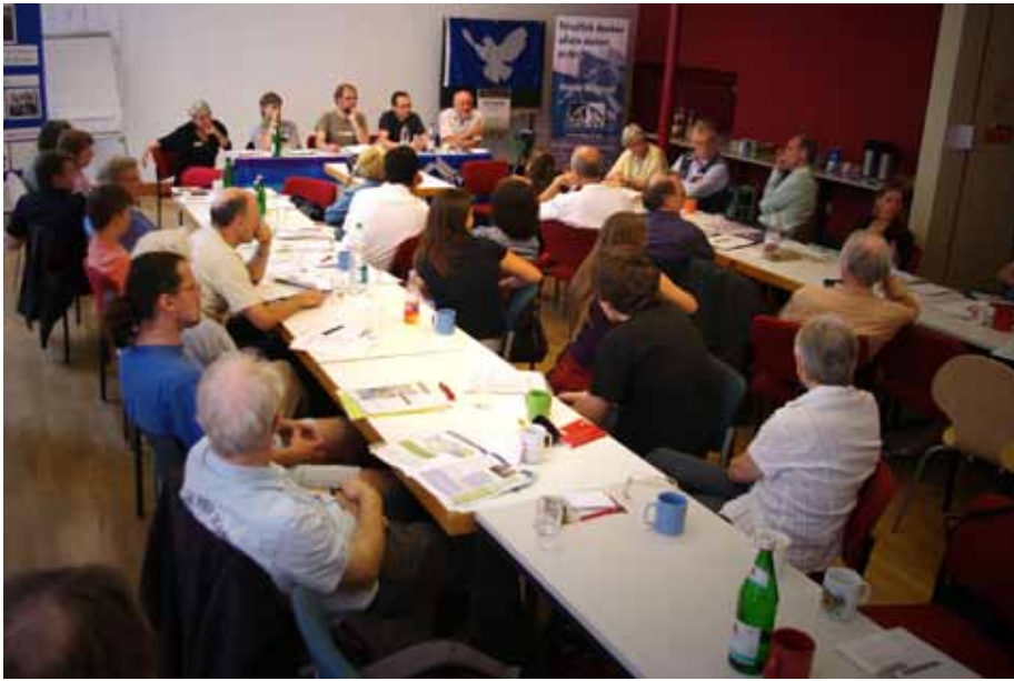
Fachtagung der Kampagne in Karlsruhe mit Vertretern aus der Politik

pagne mit Briefen, Mails und persönlichen Gesprächen nach der Wahl an ihre Aussagen erinnert und einen Forderungskatalog aufgestellt.