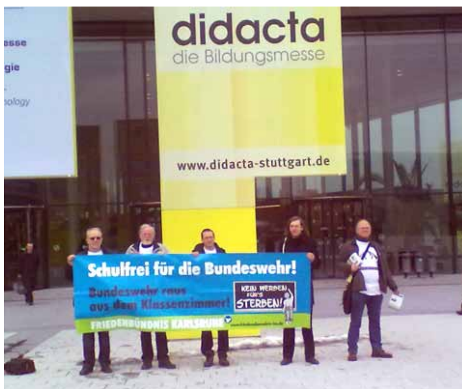
Proteste gegen die Bundeswehr auf der Bildungsmesse didacta in Stuttgart