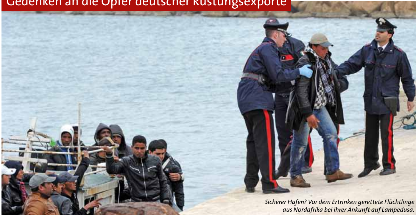
Sicherer Hafen? Vor dem Ertrinken gerettete Flüchtlinge aus Nordafrika bei ihrer Ankunft auf Lampedusa.

Frühjahr 2011 – in Nordafrika kämpft ein brutaler Diktator um seinen Machterhalt und scheut nicht den Einsatz massiver Waffengewalt gegen sein eigenes Volk. Der »Arabische Frühling«, der in Tunesien und Ägypten und weiteren Staaten des Nahen Ostens die Demokratiebewegung erblühen lässt, scheint auch Libyen, Syrien und den Jemen ergriffen zu haben.