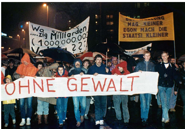
Blick auf den Anfang des Demonstrationenzuges von 500.000 Menschen in Leipzig am 06.11.1989.