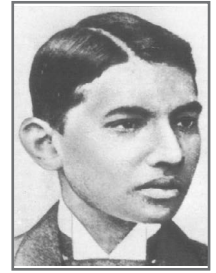
Gandhi als Student 1891

Gandhi lebte von 1869 bis 1948. Er machte eigene Diskriminierungserfahrungen unter dem Apartheidsregime in Südafrika und prägte später den „gewaltfreien Widerstand“ gegen die britische Kolonialherrschaft in Indien. Für viele Menschen, die sich friedenspolitisch engagieren und sich als Pazifist*innen verstehen, ist Gandhi ein Vorbild. Finden Sie genauer heraus, wer Gandhi war. Erstellen Sie einen Zeitstrahl mit insgesamt zehn ausgewählten Daten, Fakten oder Begebenheiten , die Sie für wichtig halten, um Gandhi als Person zu charakterisieren. Angefangen mit seiner Geburt in Porbandar bis zu seinem Tod durch ein Attentat in Neu-Dehli.