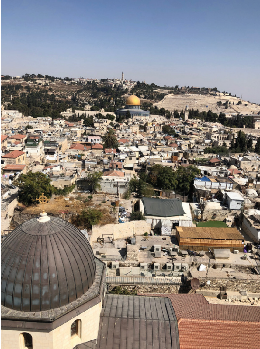
Für diesen Blick auf die Altstadt von Jerusalem mit Tempelberg und Felsendom in der Bildmitte erklomm Till den Turm der Erlöserkirche