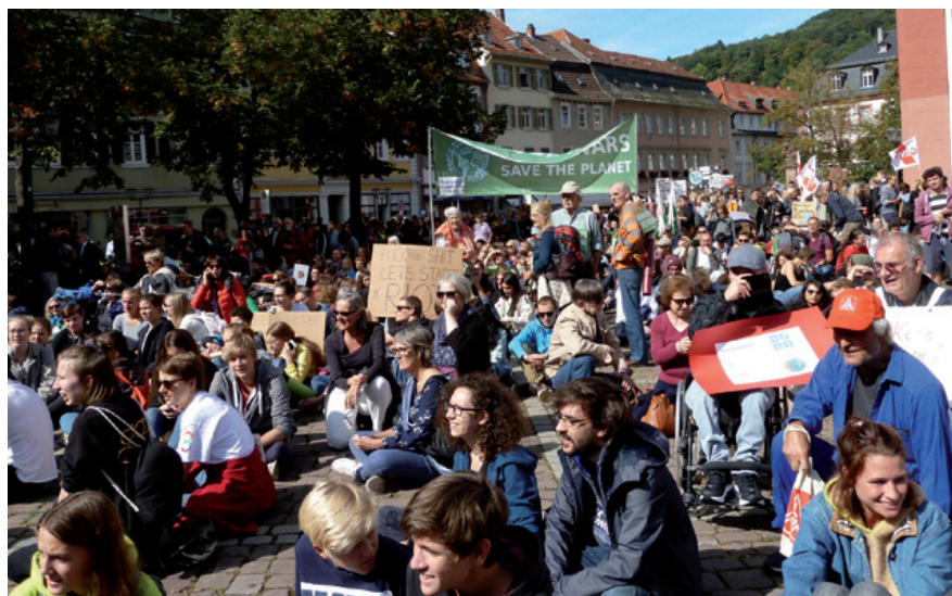
Sit-in beim weltweiten Klimastreiktag 2019 auf dem Uniplatz in Heidelberg