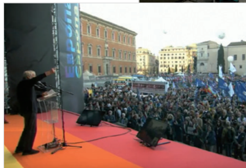
Schnappschuss von der Redner:innenbühne an der Piazza Repubblica in Rom am 5.11.2022