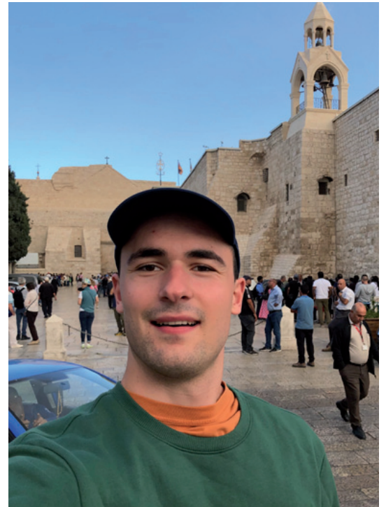
Ein Selfie auf dem Krippenplatz in Bethlehem mit Geburtskirche.