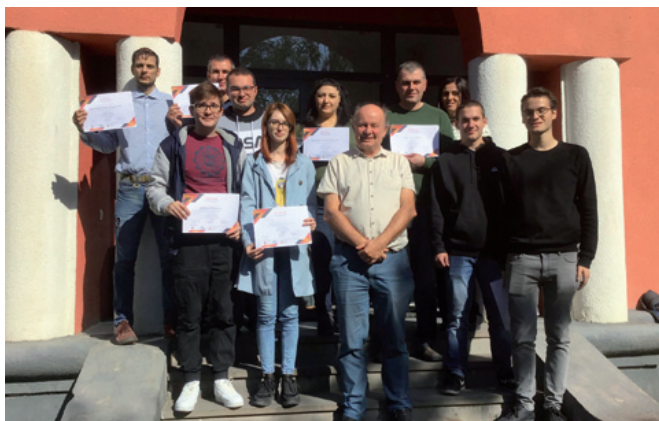
Teilnehmer:innen eines Seminars von act for transformation in Georgien zur Fortbildung von Personen, die beratend für Militärdienstentzieher und Deserteure tätig werden

Der Großteil der Georgier ist gegen die Einwanderungswelle aus Russland. Daraus wird auch kein Geheimnis gemacht. Im gesamten Land sieht man russlandkritische Graffitis und auch aus ihrer eigenen Meinung zur Situation machen die Georgier kein Geheimnis. Man muss bedenken, dass die georgischen Regionen