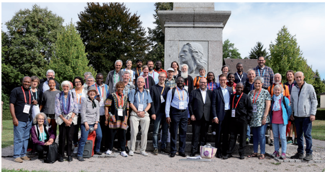
Internationale Gäste am Turenne-Denkmal in Achern