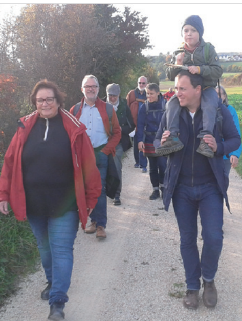
Kleine und Große auf den Spuren des Hl. Martin unterwegs im Donautal von Obermarchtal bis Untermarktal beim pax christi Pilgertag