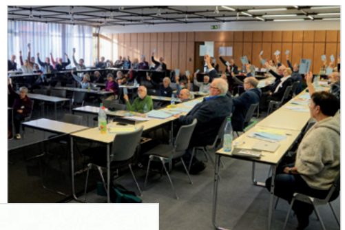
pax christi Delegiertenversammlung 2022 in Fulda – den Abstimmungen gingen intensive Diskussionen voraus