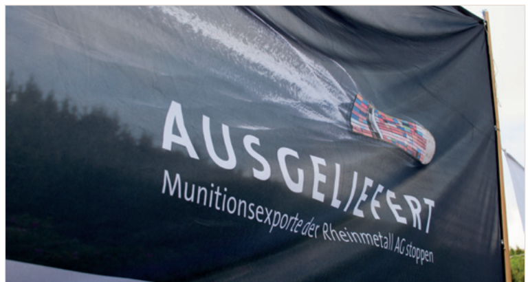
„Ausgeliefert“ – Protest gegen Rüstungsexporte der Rheinmetall AG

Ich empfinde es als sehr großen Erfolg, dass ich es zusammen mit der „Aktion Aufschrei – Stoppt den Waffenhandel!“, Greenpeace und pax christi unter hohem Zeitaufwand erreichen konnte, dass Saskia Esken in die Hauptverhandlungsrunde der Koalitionsverhandlungen Mitte November 2021 ein nationales Rüstungsexportkontrollgesetz (REKG) mitnimmt und ab Zeile 6533 des Koalitionsvertrags zu einer wirklich restriktiveren Rüstungsexportpolitik verankern konnte. Der neue Staatssekretär im Bundesministerium für Wirtschaft und Klima, Sven Giegold hat dann auch im Februar 2022 den