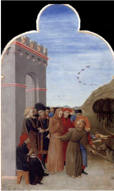
Szene aus der Legende „Der Wolf von Gubbio“: Der Hl. Franziskus und der Wolf