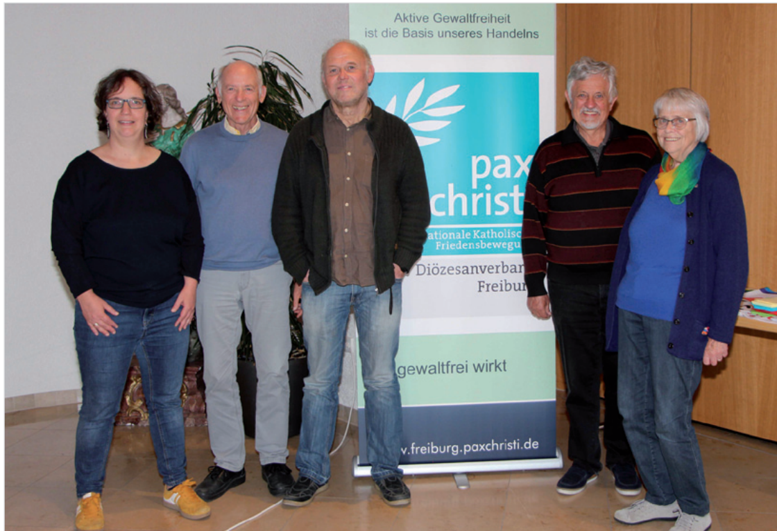
Das für drei Jahre neu bestätigte Vorstandsteam