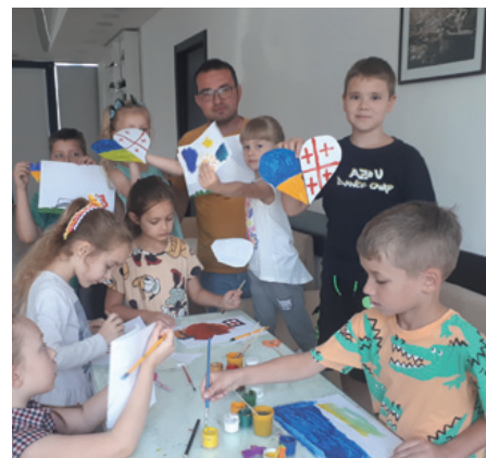
Arbeit mit geflüchteten Kindern im Büro von act for transformation in Tbilisi, Georgien