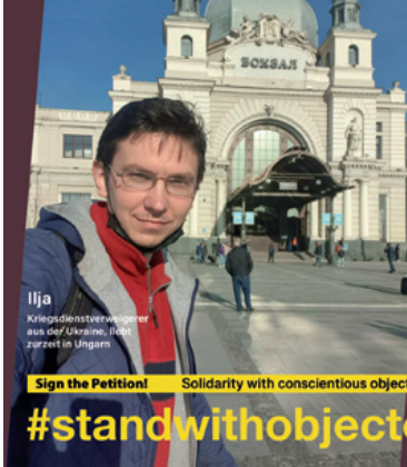
Ilja Kriegsdienstverweigerer aus der Ukraine, lebt zurzeit in Ungarn

Ich möchte klarstellen wie gefährlich Patriotismus ist. Klarstellen, wie absurd es ist so viele Menschenleben zu opfern um eine Grenzlinie auf der Landkarte neu zu ziehen.